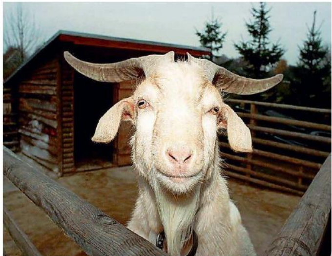
Die Ziege wird auch Bergmannskuh genannt. Sie ist Teil des Naturschutz-Projektes.

Überzeugt vom „Landschaftslabor Bergmannskuh“ ist der Stettweiler Bürger Ulrich Träm. Er will einen Förderverein gleichen Namens gründen und die Projekthalte in die Bevölkerung transportieren. Bedenken kamen von Landwirten, die um die Beschneidung ihrer Rechte zur Bewirtschaftung fürchten. Detlef Reinhard: „Es könnten sogar zusätzliche Mittel für Euch erwirtschaftet werden. Doch lassen Sie sich beraten, damit die Projektvorgaben erfüllt werden.“ (siehe auch unten stehenden Text)